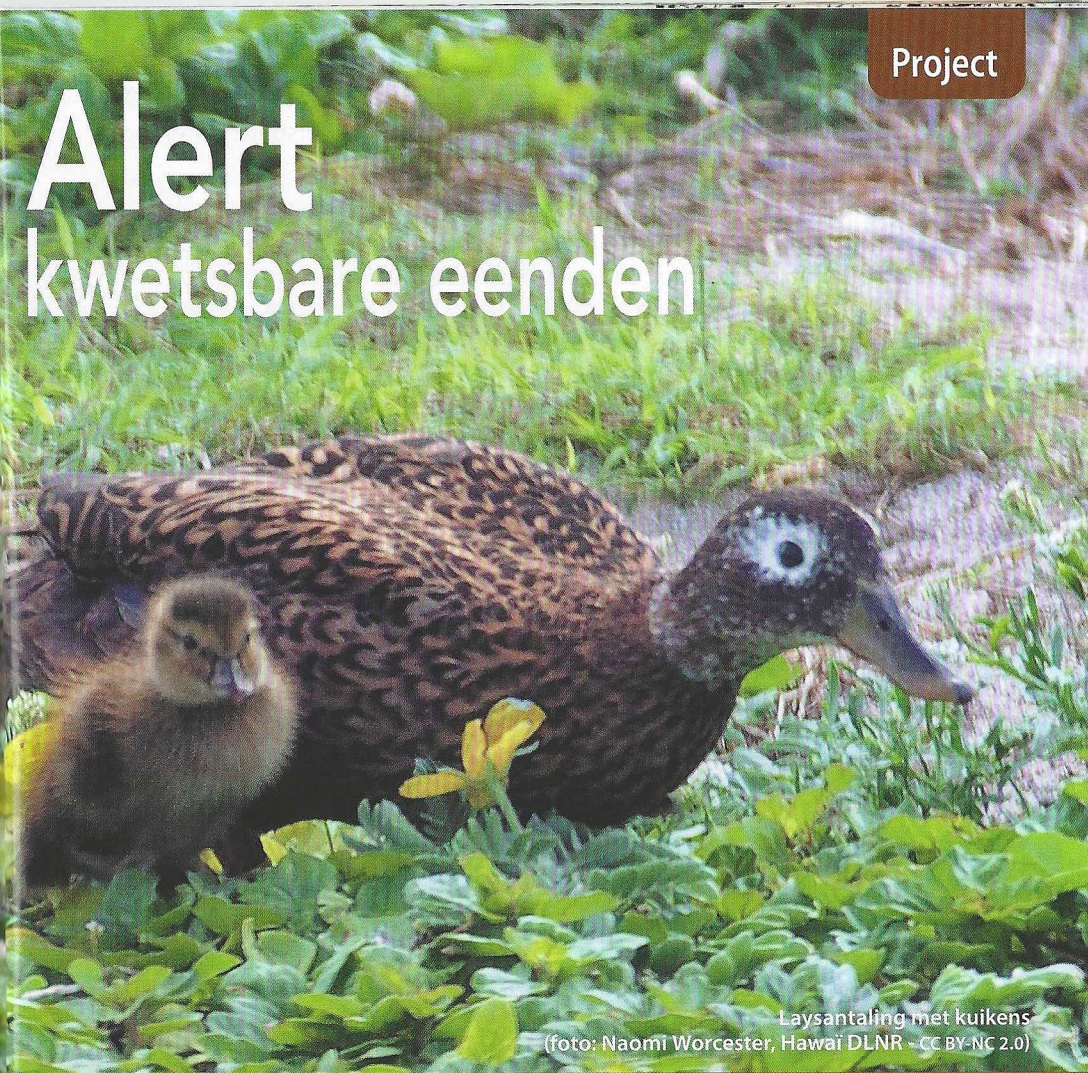
Laysantaling met kuikens

De Focusgroep Kwetsbare Watervogels brengt sinds een aantal jaren een aantal watervogelsoorten onder de aandacht die steeds minder voorkomen in de collecties van onze liefhebbers, en dus steeds moeilijker te vinden zijn. Het kleine aantal dieren dat nog aanwezig is, brengt ook mee dat het genetische reservoir van deze soorten steeds kleiner wordt – met risico's van inteelt, voornamelijk onvruchtbaarheid. Uiteindelijk kan de combinatie van beide evoluties ertoe leiden dat deze soorten uit onze collecties verdwijnen. En eens verdwenen is er helaas geen weg terug.